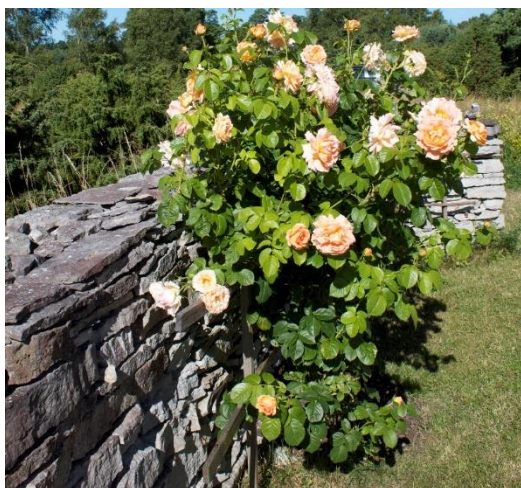
Rosor och kalkstensmurar.

Att Gotland är en ekokommun med målet att göra Gotland till ett ekologiskt hållbart samhälle till år 2025, kan bidra till att öka ekoturismen. I dagsläget deltar Gotland aktivt i nätverket Cruise Baltic, ett nätverk som består av 28 destinationer från tio länder och som gemensamt arbetar för en utveckling av Östersjön som kryssningsdestination.