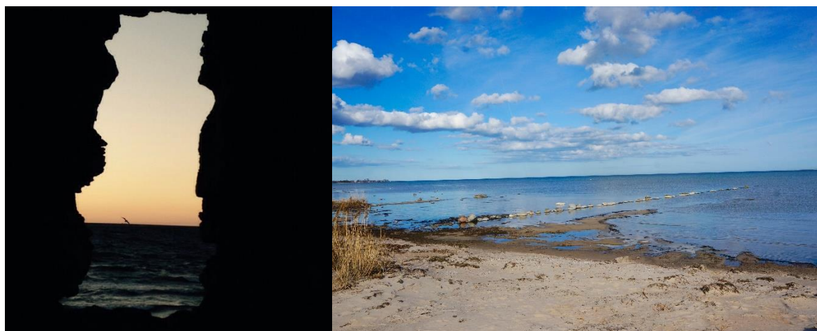
Gotlands raukar och stränder är välkända och kan upplevas med bussresa om fartygen stannar fler timmar i hamn.

Kryssningsrederierna satsar mer och mer på exklusiva aktiviteter ombord på sina fartyg. Exempelvis klättrväggar, skridskobanor, nöjesfält och avancerade vattenrutschbanor. Nu höjer Norwegian Cruise Line ribban ytterligare ett snäpp för vad som är möjligt att integreras i ett fartyg. Det är kryssningskeppet Norwegian Joy som blir först med att erbjuda en racerbana i två nivåer för gokart, enligt rederiet 8 .