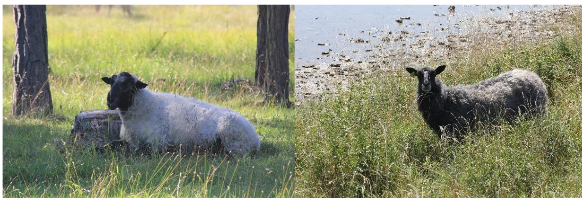
Får är ett av karaktärsdjuren på Gotland. De är viktiga för att upprätthålla det öppna landskapet och för köttet och för sin ull. Temaresor till någon gård med ull skulle kunna erbjudas.

Längre tid iland skapar möjligheter för helt nya upplevelsepaket, där bussresenärerna kan uppleva Gotlands olika kultur- och naturmiljöer. Samtidigt som bokningar av utflykter via internet kommer att öka och fler kryssningsresenärer kommer att ordna sina egna utflykter. Då gäller det att erbjuda hållbara resealternativ även för dem som reser på egen hand.