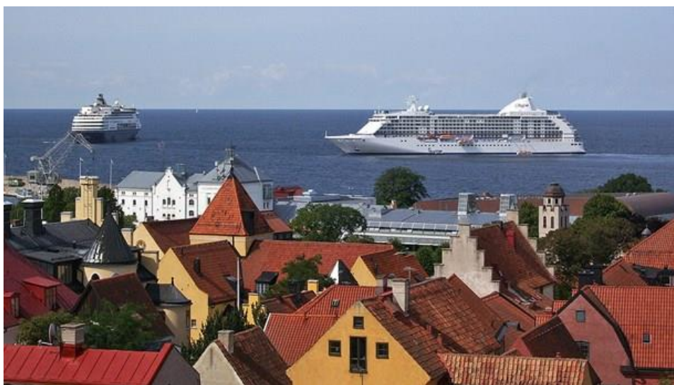
Tidigare har kryssningsfartygen varit tvungna att stanna på redden och kryssningsturismen har därför minskat.

Tidigare har kryssningsfartygen ankrat upp på redden och mindre båtar har transporterat gästerna mellan fartyg och land. Genom att passagerarna med den nya kryssningskajen själva kan gå av fartyget kan vistelsetiden öka till mellan sex och tio timmar. Det innebär också att kryssningsgäster i högre grad kan välja sina egna utflykter på ön.