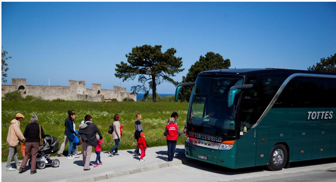
Turistbuss utanför Visby ringmur. Foto: Gotland Excursion AB (Bilden är beskuren)

Bilden visar sambandet mellan olika aktörer vid kryssningsresor. Bilden är skapad av Monica Frisk.