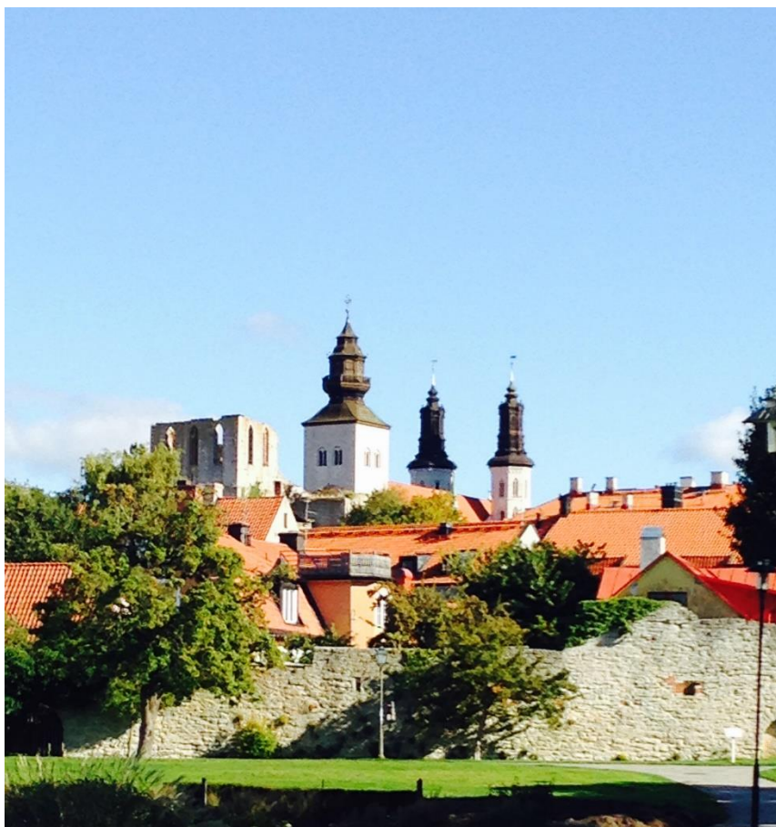
Visby med ringmuren är ett av UNESCO:s världsarv.

Gotland har varit bebott sedan stenåldern och det finns 42 000 kända fornlämningar på ön. Sjöfarten har alltid utgjort en viktig del av Gotland och det finns lämningar som visar att kontakter med fjärran länder fanns redan på järnåldern. Under Hansatiden var Visby en av norra Europas viktigaste handelsstäder. Visby har kända bosättningar från 700-talet och är sedan den 9 december 1995 ett av UNESCO:s världsarv.